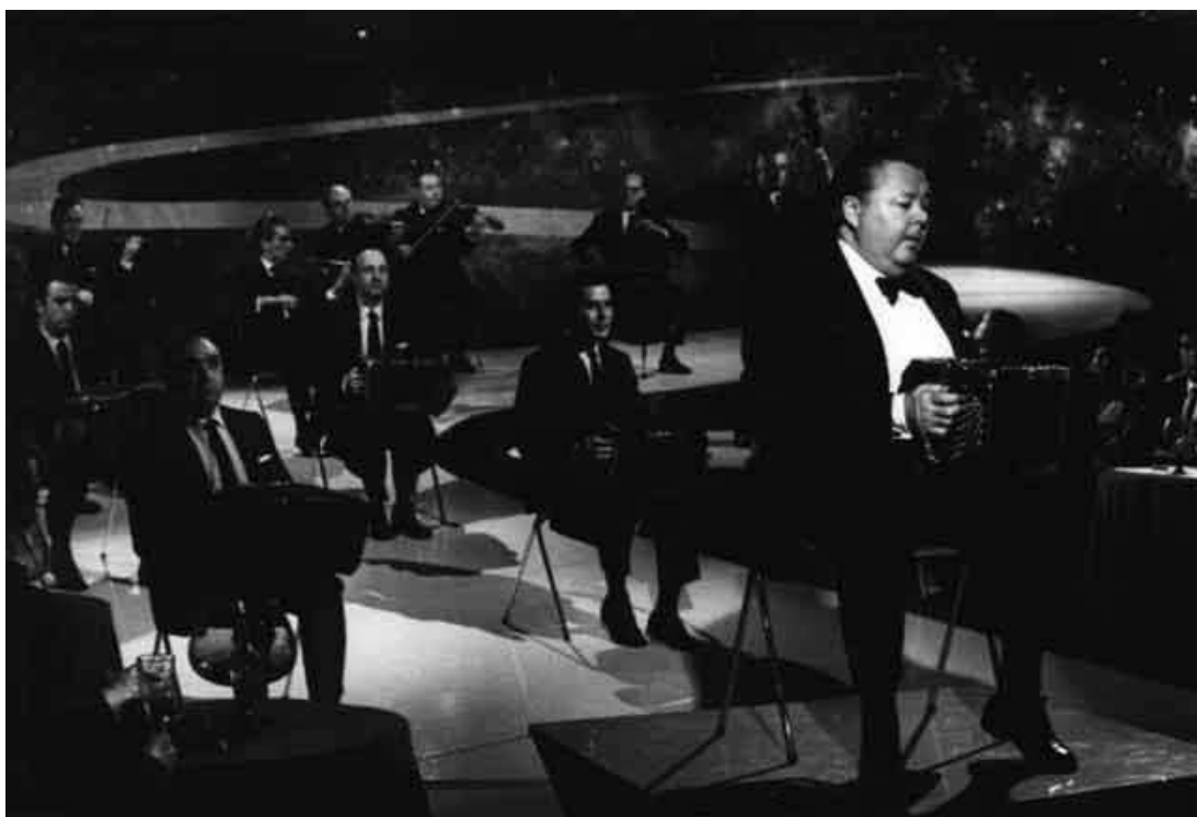
Aníbal Troilo (1911-1975)